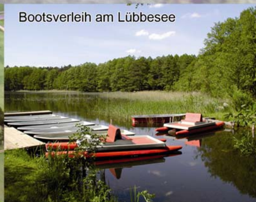
Bootsverleih am Lübbensee