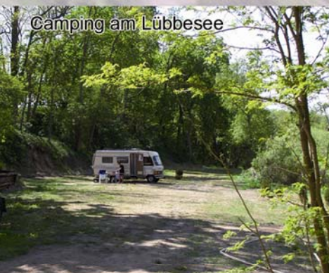
Camping am Lübbensee

Wir bieten Ihnen für Ihre Feiern und Veranstaltungen das passende Ambiente. Ob mit bis zu 150 Personen im Partystall oder im Freien mit 2000 Gästen - alles lässt sich realisieren - vom Kindergeburtstag bis hin zum Musikfestival. Fragen Sie uns zuerst!