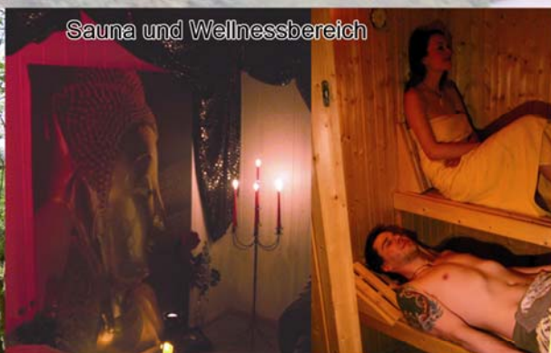
Sauna und Wellnessbereich