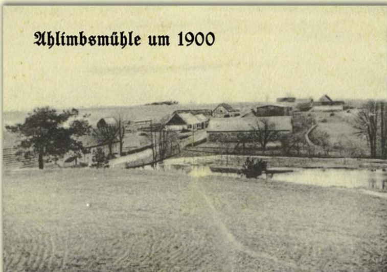
Ahlimbsmühle um 1900

1572: Die „Bergermollen“ wird genannt. Konsens für die von Holtzendorff-Vietmannsdorf zur Errichtung einer Windmühle an der Stelle der Wassermühle, die im Sommer wegen Wassermangels still steht.