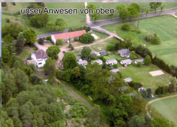
unser Anwesen von oben